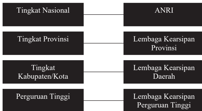
Gambar 1.2: Penyelenggara kearsipan

pencipta arsip. Pencipta arsip adalah pihak yang mempunyai kemandirian dan otoritas dalam pelaksanaan fungsi, tugas, dan tanggung jawab di bidang pengelolaan arsip dinamis (aktif dan inaktif) (Muhidin dan Winata, 2016).