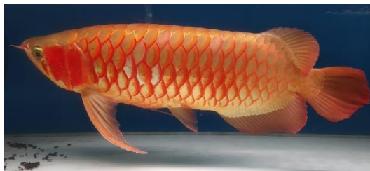
Gambar 1. 3. Ikan Arwana

Perancangan Pasar Rakyat Kecamatan Suhaid akan menambahkan sebuah fasilitas berupa pusat pemasaran ikan arwana dalam bentuk Showroom Arwana. Penambahan fasilitas ini didasari karena Kecamatan suhaid yang dikenal dengan sebutan “Bumi Arwana” merupakan daerah budidaya arwana terbesar di Kabupaten Kapuas Hulu. Berdasarkan data BPS Kabupaten Kapuas Hulu, pada tahun 2023 jumlah petani arwana di kecamatan suhaid mencapai 224 petani dengan jumlah kolam/tambak sebanyak 687 unit dengan luas keseluruhan 41.220 m 2 dan jumlah produksi mencapai 2.650 ekor (Kabupaten Kapuas Hulu Dalam Angka, 2024). Dengan jumlah petani arwana dan jumlah produksi yang cukup besar, ironisnya Kecamatan Suhaid belum memiliki sebuah tempat yang digunakan untuk pemasaran arwana secara terpusat. Oleh karena itu, menambahkan sebuah fasilitas pusat pemasaran arwana pada Pasar Rakyat Kecamatan Suhaid merupakan sebuah ide yang tepat. Hal ini juga didasari dengan adanya permintaan ikan arwana yang terus meningkat, baik dari pasar domestik maupun internasional, menunjukkan bahwa sektor ini memerlukan infrastruktur yang lebih baik untuk memfasilitasi pemasaran, pengelolaan, dan pengiriman.