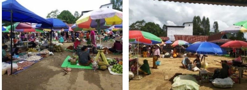
Gambar 1. 2. Suasana Pasar Minggu Suhaid

kendaraan yang parkir terlalu dekat dengan jalan sehingga mengganggu pengguna jalan, serta banjir yang sering terjadi pada kawasan dalam 3 tahun ke belakang.