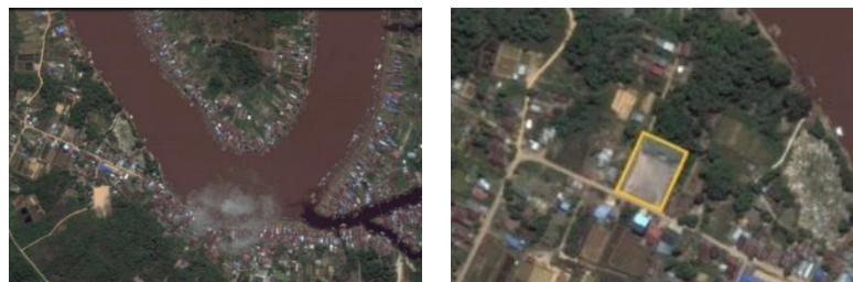
Gambar 1. 1. (Kiri) Wilayah Pusat Kec. Suhaid, (Kanan) Lokasi Pasar Minggu Suhaid.

Minggu Suhaid”. Sesuai dengan namanya, pasar ini hanya beroperasi di akhir pekan saja (Sabtu dan Minggu). Hal ini disebabkan karena pedagang utama yang menjual bahan mentah seperti sayur, buah – buahan, serta daging berasal dari luar Kecamatan Suhaid dan mereka hanya akan pergi berdagang ke Kecamatan Suhaid di akhir pekan saja (Sabtu dan Minggu). Lokasi Pasar Minggu Suhaid berada di Dusun Sungai Lalau, Desa Nanga Suhaid, Kecamatan Suhaid, tepatnya di area terminal bus Desa Nanga Suhaid yang sudah tidak beroperasi lagi. Lokasi Pasar ini sangat strategis karena mudah di akses baik dari jalur darat (menggunkan mobil atau sepeda motor) maupun dari jalur sungai (menggunkan perahu dan speedboat ). Pasar Minggu Suhaid berada di bawah naungan BUMDes Nanga Suhaid dan sudah beroperasi dari tahun 2018 sampai sekarang. Pedagang yang berjualan di Pasar Minggu Suhaid tidak hanya berasal dari daerah setempat saja melainkan dari kecamatan luar (Kecamatan Hulu Gurung dan Kecamatan Seberuang) bahkan ada Yang berasal dari Kabaupaten Sintang.