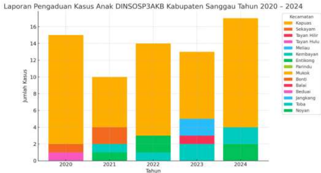
Gambar 1.1. Grafik Laporan Pengaduan Kasus Anak DINSOSP3AKB Kabupaten Sanggau Tahun 2020 – 2024