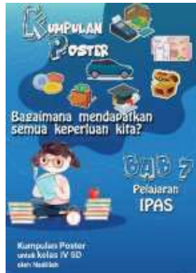
Gambar 1.1 Cover Kumpulan Poster