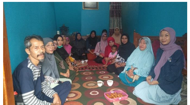
Penulis bersama KPM di Kelurahan Sungai Jawi Dalam