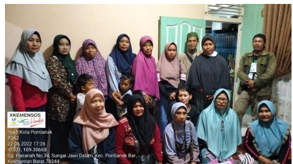
Penulis bersama KPM PKH di Kelurahan Sungai Jawi Dalam