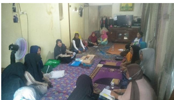
Pertemuan Peningkatan Kemampuan Keluarga (p2k2) di Kelurahan Sungai Jawi Dalam dengan modul materi mendukung perawatan ibu hamil sehari-hari