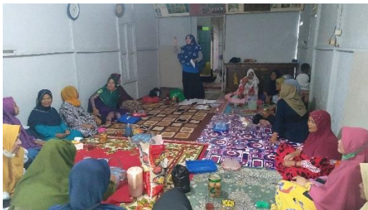
Pertemuan Peningkatan Kemampuan Keluarga (p2k2) terkait penyampaian modul materi perawatan sehari-hari ibu hamil di Kelurahan Sungai Jawi Dalam