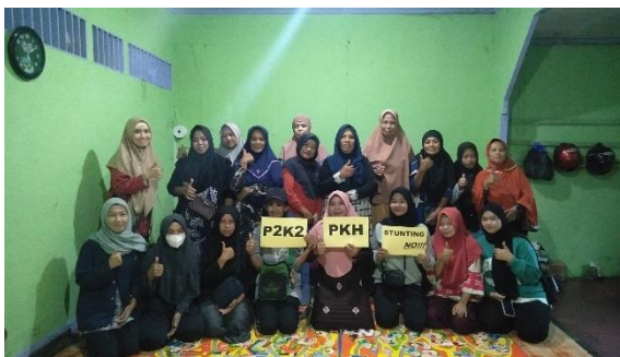
Penulis bersama KPM PKH dan Pendamping PKH di Kelurahan Sungai Jawi Dalam