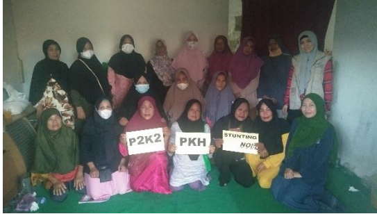
Penulis bersama Pendamping dan KPM PKH di Kelurahan Sungai Jawi Dalam