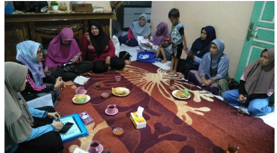
Sosialisasi yang dilakukan oleh Koordinator PKH Kota Pontianak kepada KPM terkait dengan menyebarkan berita hoax tentang pendaftaran pkh tahap 2