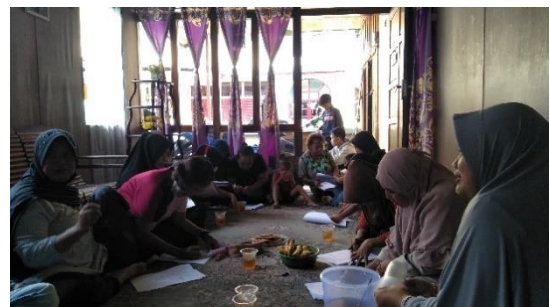
KPM PKH mengisi kuesioner yang dibagikan penulis