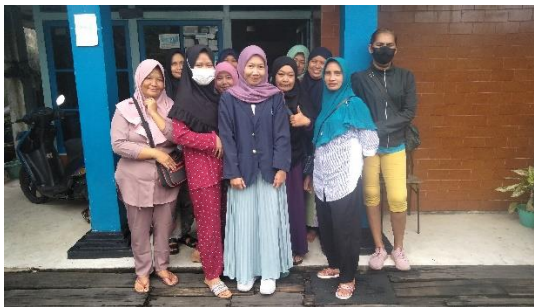
Penulis bersama KPM PKH di Kelurahan Sungai Jawi Dalam