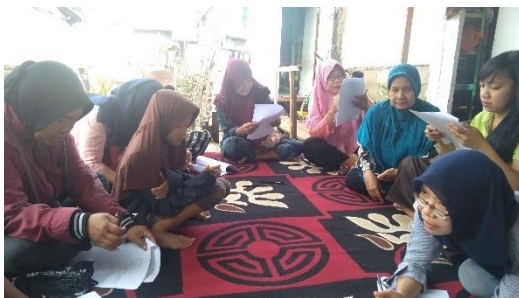
KPM PKH mengisi kuesioner yang dibagikan penulis