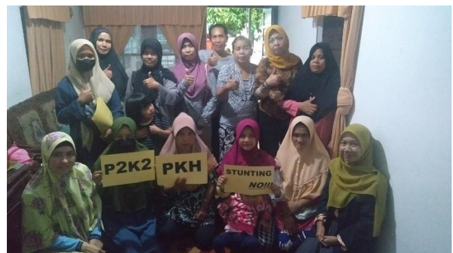
Penulis bersama KPM PKH dan Pendamping PKH di Kelurahan Sungai Jawi Dalam