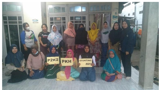
Penulis bersama KPM PKH dan Pendamping PKH di Kelurahan Sungai Jawi Dalam