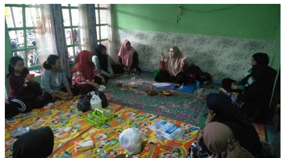
Pertemuan Peningkatan Kemampuan Keluarga (p2k2) terkait dengan modul materi mendukung perawatan ibu hamil sehari hari