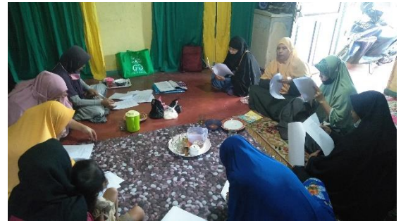
KPM PKH mengisi kuesioner yang dibagikan oleh Penulis