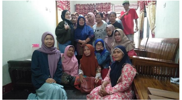
Penulis bersama KPM di Kelurahan Sungai Jawi Dalam