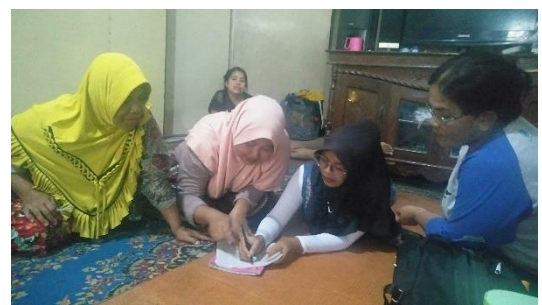
Diskusi kelompok pada pertemuan peningkatan kemampuan keluarga (p2k2) terkait materi yang disampaikan oleh Pendamping PKH