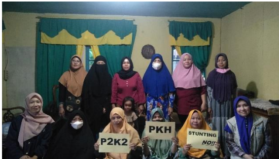
Penulis bersama KPM PKH dan Pendamping PKH di Kelurahan Sungai Jawi Dalam