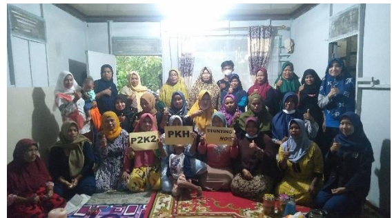
Penulis bersama KPM dan Pendamping PKH di Kelurahan Sungai Jawi Dalam