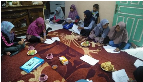
KPM PKH mengisi kuesioner yang dibagikan oleh penulis