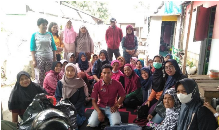
Penulis bersama KPM PKH dan Pendamping PKH di Kelurahan Sungai Jawi Dalam