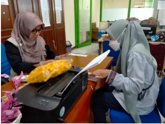
Penulis bersama Koordinator PKH Kota Pontianak