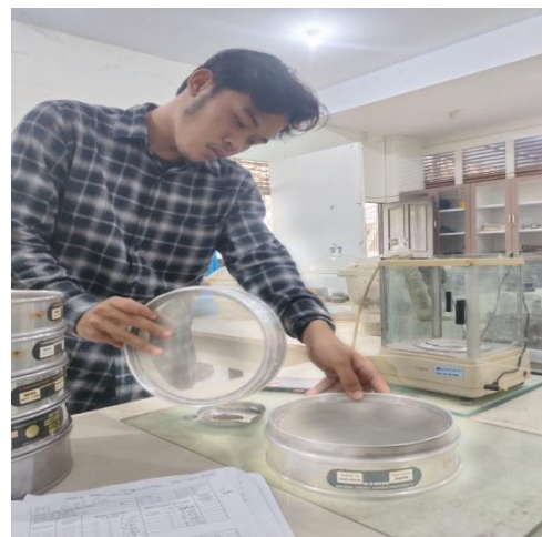
Pengujian Analisa Gradasi