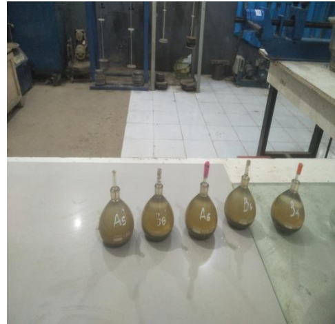
Pengujian Berat Jenis Tanah